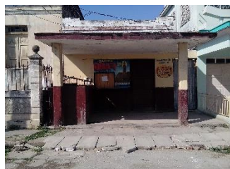
Panadería La ejemplar cerrada por falta de harina de trigo.