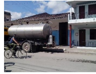
Carro de leche a granel