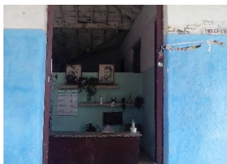
Bodega La Habanera, desabastecida y con fotos.

La recepción consciente o inconsciente de lo anterior que hacen los atribulados cubanos es, que los jefes que gobiernan a nuestro país están poseídos de un éxtasis, que viven en mundo paralelo, ya que no tienen la menor posibilidad de sacar el país adelante, que no es posible que implementen de forma sostenible todo eso, si no saben administrar ni siquiera una guarapera (en Camajuaní no existen). En fin, la nación y sus instituciones, necesitan renovarse como el ave fénix, eso es, cambiar de paradigmas, pues no aguanta más.