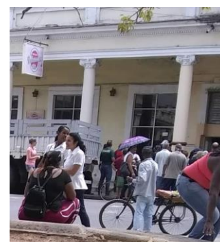
La misma cola en la Casa Rusa. Cienfuegos.