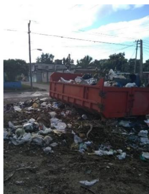
Dos Basureros ubicados en la calle 65 e/ 72 y 78, Pueblo Grifo, Cienfuegos. 10 de marzo