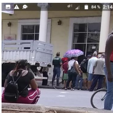
Cola tumultuosa en la Casa Rusa, de pollo y aceite. 27 de marzo. Cienfuegos.