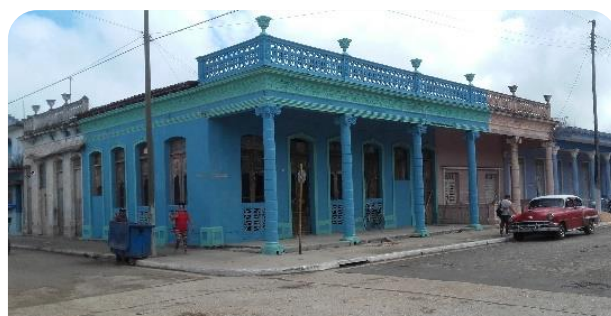
La academia de música lleva muchos años sin funcionar. Le pintaron la fachada recientemente pero no las puertas ni las ventanas. El estado constructivo es malo.