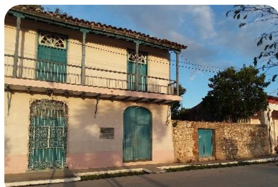
Por la falta de inversión y atención especializada, han convertido a la empleomanía en redundante.