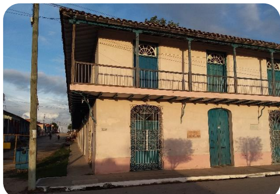
El museo constructivamente está en un estado calamitoso. Solamente la planta baja exhibe precariamente objetos, pero casi todos son fotos. De un museo funcional, a lo que tenemos, existe un trecho enorme.