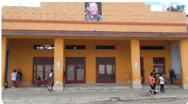
El cine Maceo está en total abandono. queda solamente la fachada. Los propagandistas del régimen le pegaron una foto de F. Castro en aras de acentuar el culto a su personalidad.

El día 9 se realizó un recorrido por Camajuani y, a priori, se pudo constatar el estado calamitoso en que se encuentran las instituciones del sectorial de cultura. Hay tres que se destacan negativamente sobremanera: la academia de música; el cine Maceo (otrora Rotella) y el museo local. También la edificación y la infraestructura de funcionamiento de la biblioteca municipal peor no puede estar, aun cuando recientemente le pintaron la fachada, así como la dotación de libros es pésima, amén de la politización de la misma. Ni tan siquiera, porque estas entidades en un sistema totalitario como el cubano, las utilicen para el adoctrinamiento y la creación de matrices de opinión, son capaces de mantenerlas como es debido. El recién concluido congreso de la UNEAC fue triunfalista, y en consecuencia pasó por alto la dramática realidad de muchas instituciones de la cultura cubana.