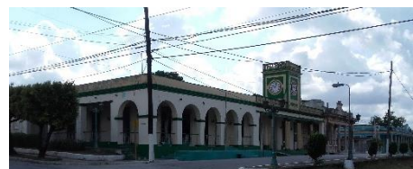
Sede del gobierno municipal de Camajuaní.

Se produce un comentario generalizado entre los camajuanenses de cómo podrán enfrentar la nueva cuarentena pues el desabastecimiento alcanza niveles nunca antes vistos en los últimos años. Peor aún, el paro laboral forzado, por las políticas de aislamiento, de los trabajadores del emergente sector privado y del estatal, así como de los consiguientes recortes en los ingresos familiares los tiene muy preocupados. El primer segmento, no posee