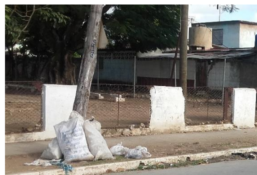
Frente a la Secundaria Básica José Martí.