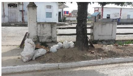
Terminal de coche motor (caratas)