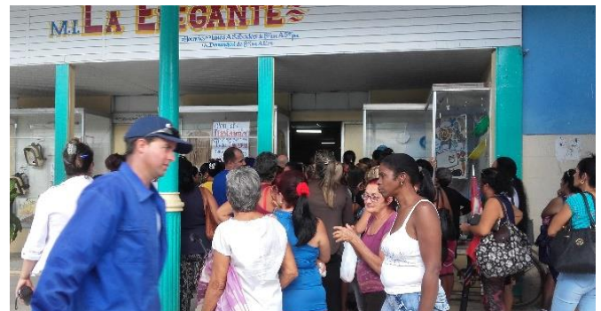
Tumultuosa cola para comprar Jabolina.