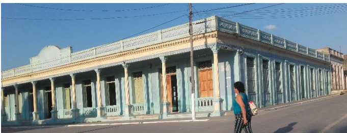
Club La Colonia Española. Actualmente es La Casa de la Cultura y posee un deterioro enorme, que la hace irreconocible.