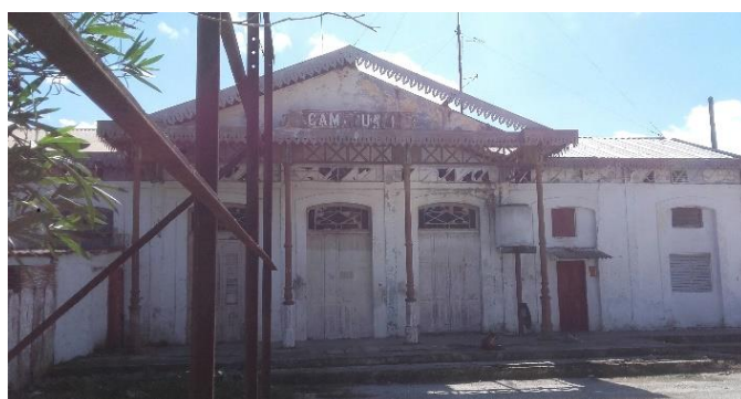
Antigua terminal de trenes. Actualmente de Carahatas (coche motor ferroviario) y también existe un taller de mecánica.