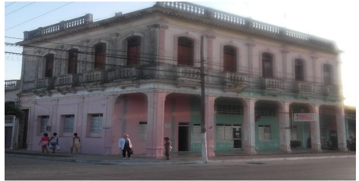
Club Los 15 Amigos, en la segunda planta. Posee un deterioro notable y está habitado por familias.