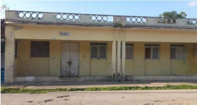
Club La Nueva Era. Actualmente es una escuela y posee un deterioro notable como se puede apreciar.