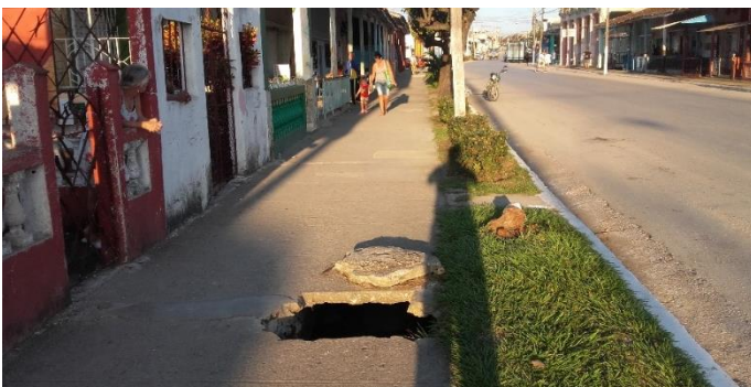
Hueco muy peligroso en la acera de la calle Real.