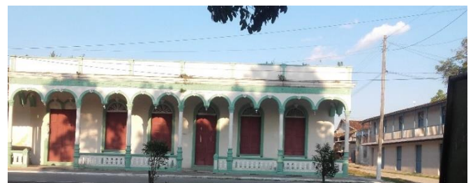
Club La Sociedad El Liceo. Actualmente es una biblioteca desactualizada y está en condiciones depauperada.