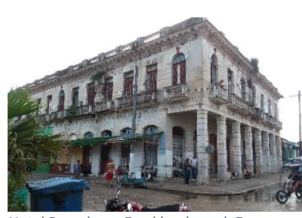
Hotel Barcelona. En el boulevard. Es un monumento a la desidia