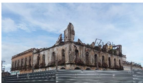
Hotel Cosmopolita. El ciclón Irma acabó de rematar el 3er piso.