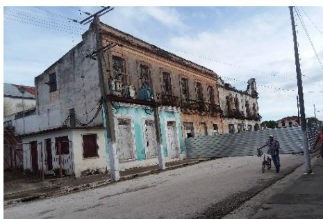
Lateral del Hotel Cosmopolita