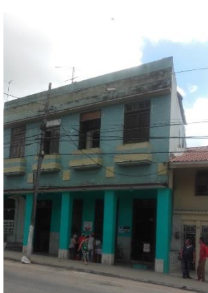
Hospedaje Comercio. Habitado por varias familias y en muy mal estado