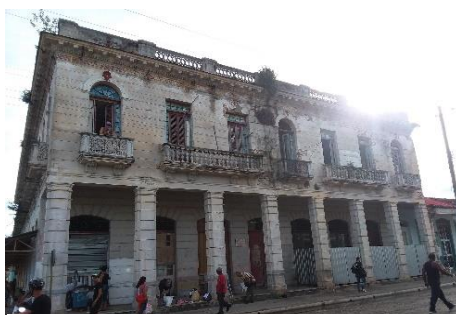
Hotel Barcelona. En estado ruinoso. Lo habitan algunas familias