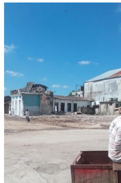
Hotel Cosmopolita después de demolido. Un gran vacío frente al parque.