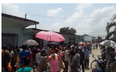
Punto de venta, TRD

Las aglomeraciones de los residentes del batey Sitiecito, ubicado a 7 kilómetro de Sagua La Grande, por el arribo del pollo, que por cierto no estaba en un estado óptimo (rancioso), demuestra la desesperación cada vez más creciente de los residentes. En otras palabras, en mayor o menor medida, tienen hambre. Todo ese despliegue, para comprar 4 postas de pollo por núcleo familiar, a la exorbitante cifra de 130.00 CUP, con el agravante que le deben a cada familia un pomo de aceite de un litro. Por otra parte, trascendió que, a los trabajadores del central azucarero, Héctor Rodríguez, enclavado en el lugar, no les vende merienda y las jornadas son de 12 horas laborables, todo un abuso.