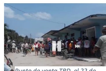
Punto de venta TRD, el 22 de abril.