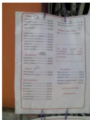
Ampliar foto, para que se pueda apreciar los elevadísimos precios.