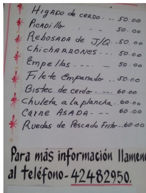
Listado de precios del restaurante particular, El Real.