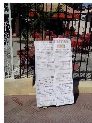
El Pavito, restaurante estatal.