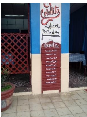
Restaurante estatal que fue una escapatoria para los pobres, ahora casi nadie compra allí.

En un recorrido por Camajuaní se pudo apreciar la cuasiparálisis de los restaurantes estatales y particulares, en la única modalidad que se permite vender los alimentos: para llevar, a lo que se le añade los merenderos. Este panorama desolador nos ofrece una idea con precisión de cuáles son las consecuencias de las reformas económicas en marcha.