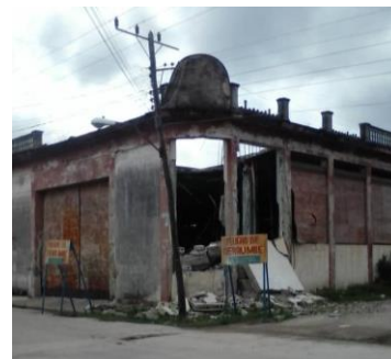
La desidia constructiva unida a los escombros y basura acumulada.

En la Villa del Undoso, otrora próspera ciudad, el patrimonio arquitectónico posee un deterioro sustancial. Revelamos como un botón de muestra al antiguo almacén de la empresa de Bebidas y Licores, ubicado en la calle Luis Mesa e/ Línea y Enrique José Varona. Aun cuando recientemente maquillaron algunas de las edificaciones más céntricas e hicieron inversiones capitales puntuales, el panorama está muy lejos de ser mínimamente aceptable.