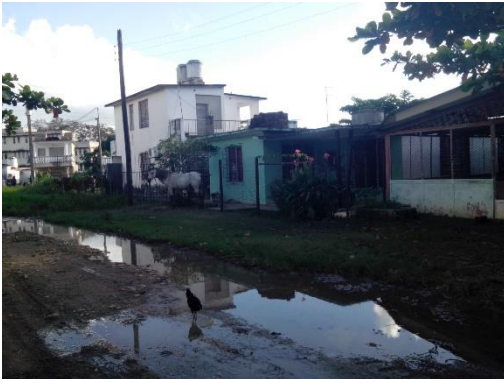
El consultorio y la casa del médico y la enfermera al final, de dos pisos.