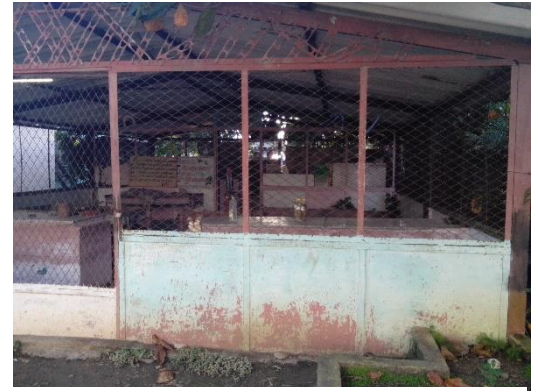
El mercado que simboliza al socialismo de estado.