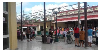
Cola para comprar helados en la cremería de Camajuaní. Casi nunca hay.