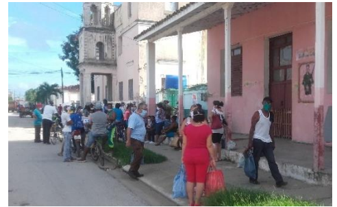
Mercado estatal de Camajuaní, para viandas y algo más.

El día de los padres las colas fueron tremendas en el tamaño y por la ansiedad de la genta para comprar un pedazo de carne o cualquier otra cosa.