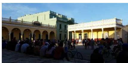
Tienda Unión de Remedios, en espera de detergente.