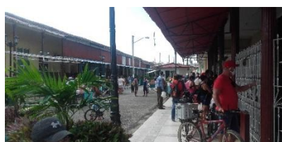
Boulevard de Camajuaní. La gente merodeando a ver que cae.