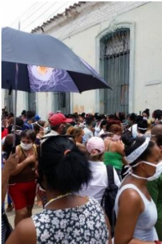
Tienda TRD de Remedios, personas buscando que comer.