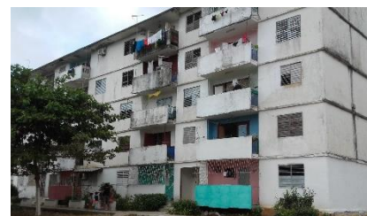
Edificio nro. 10 del Rpto. Minerva