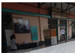
El mostrador de exhibición está vacío. Se venden botellas para llevar.

El combinado (tres fábricas) de hielo, refresco y ron, Benito Ramírez de Camajuaní, lleva como “Vanguardia Nacional” más de 30 años consecutivos, pero hace mucho que las dos primeras pararon sus máquinas, de modo que el ron Decano y/o el Vodka Villa Clara están salvando la honrilla. Por esas cuestiones que solamente se dan en la Cuba socialista de hoy, la producción del refino también se ha visto afectada por la falta de lo que los especialistas del ramo denominan: el caldo. A todas luces, los aspectos ideológicos y políticos tienen un peso extraordinario para la obtención de reconocimientos, pues si ubicáramos el referido combinado en un país con una economía de mercado mínimamente operativa, quebraría automáticamente.