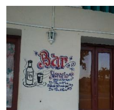
Cerró varios días por falta de ron y demás.

El domingo 15 la oferta de ron en Camajuaní era casi nula. Hace más de un mes del desabastecimiento en los bares de esta bebida, por lo que se ha puesto al descubierto una vez más la ineficiencia del socialismo real cubano. Cualquiera pudiera objetar: por falta de ron no se muere ni enferma nadie, así como no pocas esposas lo detesta, pues les crea problemas familiares. A lo que hay que responder: por algo la gente lo consume. No todo en la vida está dado por satisfacer las necesidades más perentorias, de modo que resulta muy cubano y universal: fiestar,